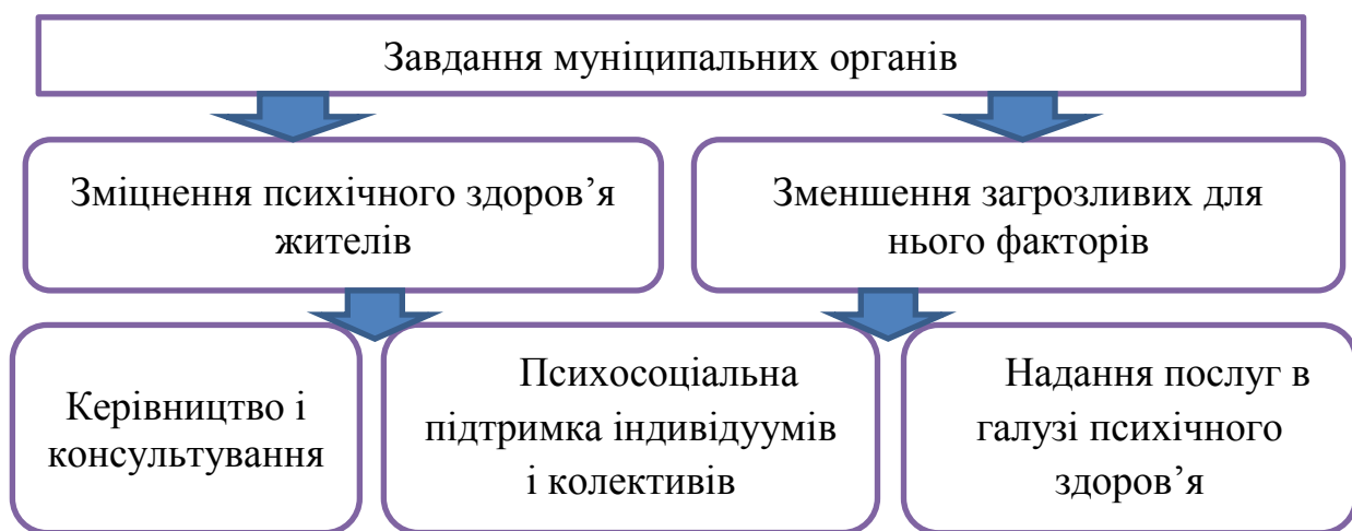
Рис. 3. Завдання муніципальних органів

Завданням муніципальних органів є зміцнення психічного здоров'я жителів і зменшення загрозливих для нього факторів. Ця робота включає в себе керівництво і консультування, психосоціальну підтримку індивідуумів і колективів, а також надання послуг в галузі психічного здоров'я (рис. 3) [16].