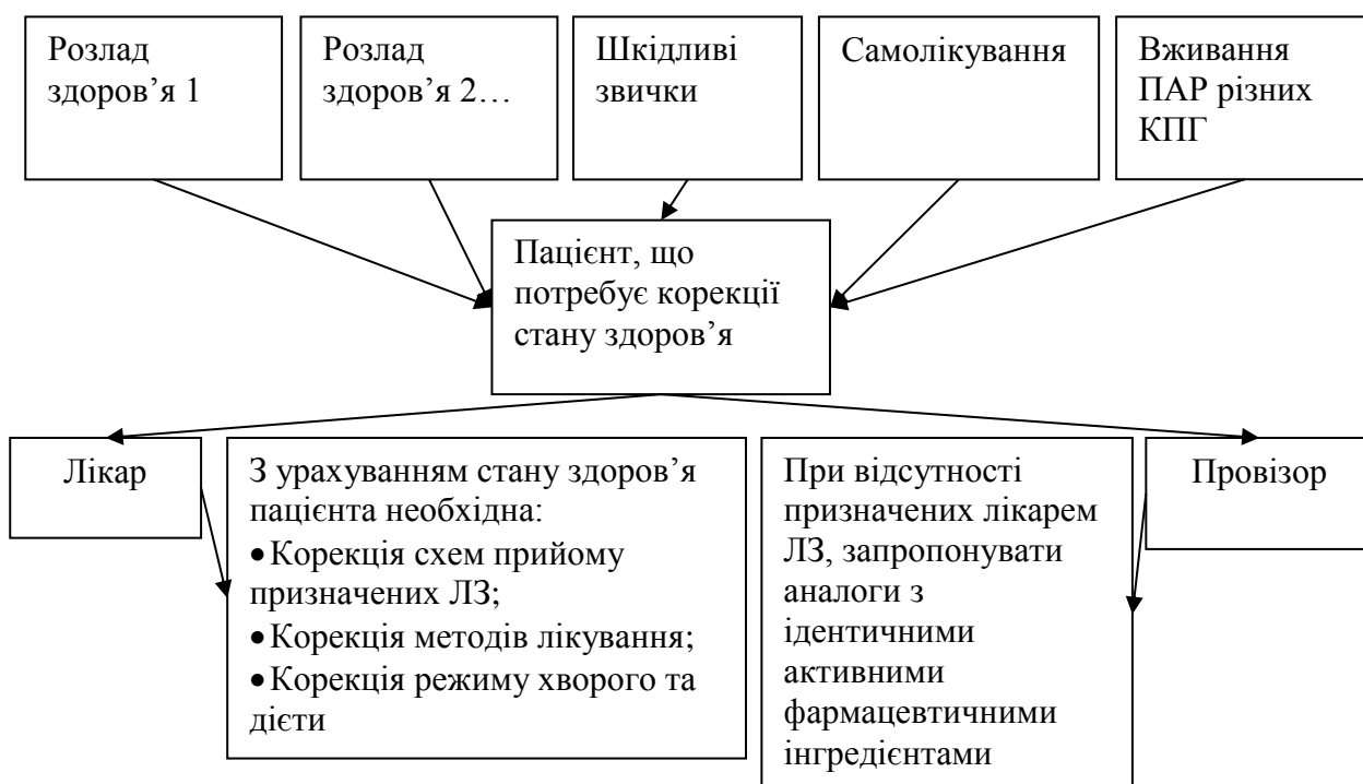
Рис. 1. Корекція у галузі медицини та фармації (авторська розробка на основі [5, 6, 7, 8, 10])

Аналіз літературних джерел показав, що сучасні вчені галузі медицини та фармації у своїх наукових працях вказують на різні варіанти вживання терміну корекція, які наведено на рис. 1.